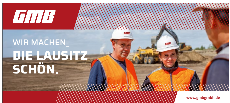
Beispielhafte Gestaltung im neuen Design

Im Zentrum unseres neuen Markenauftritts steht ein überarbeitetes Logo. Es setzt bewusst auf Klarheit, Kraft und Lesbarkeit. Klare Linien, reduzierte Formen und eine einheitliche Gestaltung sorgen für mehr Prägnanz und Wiedererkennbarkeit. Diese Weiterentwicklung ist zugleich